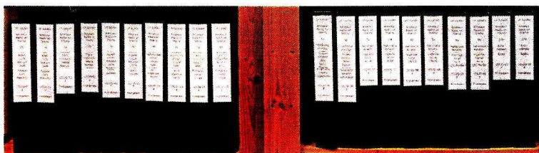
De nya arkivbeständiga pärmarna

Ett digitalt register för att hantera det inskannade materialet har utvecklats och finns tillgängligt på museets hemsida. https://radiomuseet.se/radiomuseets-databaser/