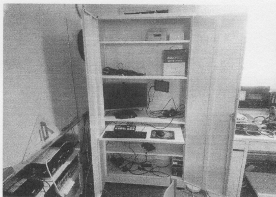
Plåtskåpet är på plats

För att förbättra vår utrustning för hybridmöten har vi köpt in en fjärrstyrd kamera (PTZ-kamera) som är fast monterade och uppkopplade. Vi har också köpt ett skåp där övrig utrustning kan vara inlåst, och uppkopplat. För Youtube-sändningarna har vi anskaffat en gimbal och en powerbank för att lätt kunna filma för hand utan skakningar. Vi har också köpt in trådlöst HDMI för att kunna använda kameran på gimbalen i direktsändningar.